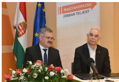
Balog Zoltán Miniszter Úr előadásán jelentette be, hogy többek között Nyírbátor 3,8 milliárd forintos adószággállományát is teljes egészében átvállalta az állam.