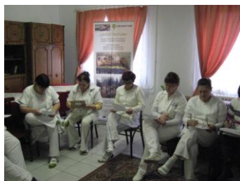
Szociális szakemberek képzése