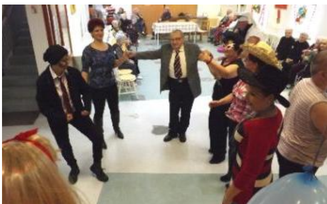
A farsangi mulatozás időset és fiatalot egyaránt megmozgatott

Az év végi adventi és karácsonyi ünnepkört követően nem csak a tavasz közeledte, de az ehhez kapcsolódó ünnepkör is nagy várakozással tölti el a szép kort megélt „gondozottakat”.