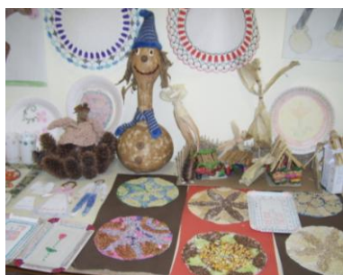
„Kézműves” gyerekek alkotásai

Számos program, rendezvény valósul meg a 600 milliós Gyermekesély Program pályázat kereteiben