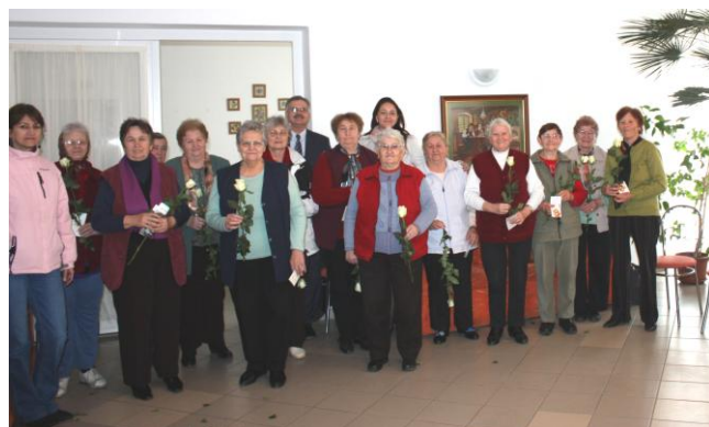
Nőnapi köszöntő Encsencsen

A jelenlévők közül jó néhányan táncra perdültek, de nem maradhatott el a közös nótázás, a tombolasorsolás és a finom friss farsangi fánk sem.