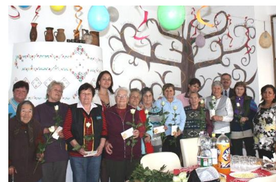
Nőnap-i köszöntés a Penészleki idősek otthonában

Neves politikusok nemes célokkal látogattak kistérségünkbe