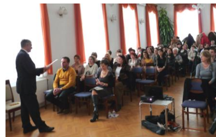
A társulás elnöke beszámolt a pályázati eredményekről

A fiatalok társadalmi integrációja pályázat záró konferenciája