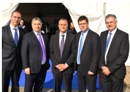
Orbán Viktor miniszterelnök úr Nyírgelsén avatott egy 600 millió forintos új munkahelyeket teremtő beruházást

Neves politikusok nemes célokkal látogattak kistérségünkbe