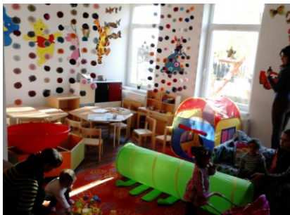
Biztos Kezdet Gyerekház Nyírmihálydiban