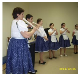
Népzenei csoport - Piricse

Sport és szabadidő programelem keretében 13 település iskoláiban zajlanak tömegsport foglalkozások, sportszakkörök a támogatásunkkal (Judo, foci, aerobik, ping-pong, és egyéb sportágak keretében)