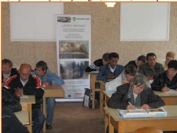
A tréning résztvevői

A pályázat keretein belül lehetőség adódott 9-10. osztályos felzárkóztató képzés szervezésére, OKJ-s tanfolyamokon különböző szakmák elsajátítására és kiscsoportos foglalkozás keretében a személyiségfejlesztő, motivációs tréningeken való részvétellel. A tréningeken és tanácsadásokon 70 fő vett részt a kistérség alábbi településeiről: Nyírbátor, Nyírboogát, Nyírmihálydi, Nyírlugos, Kisléta, Máriapócs.