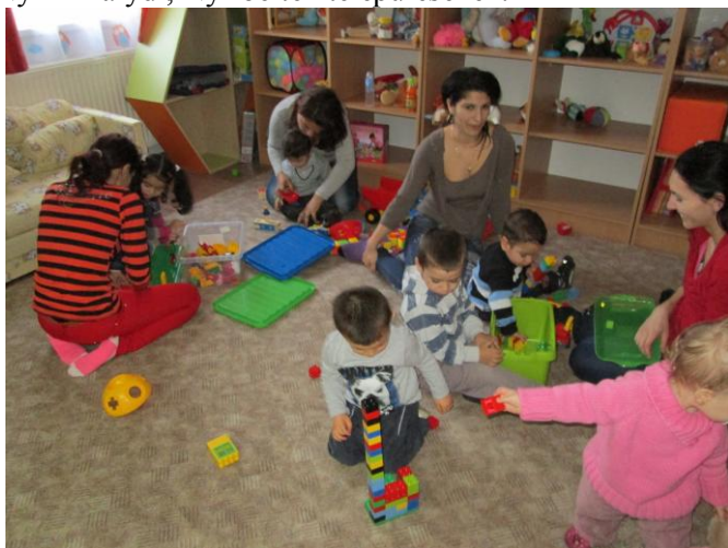
Kisdedek játszanak a Biztos Kezdet Gyerekházban - Nyírbétek

Ennek keretében 2013. decemberében megnyílt mind a három Biztos Kezdet Gyerekházunk Kisléta, Nyírmihálydi, Nyírbétek településeken.